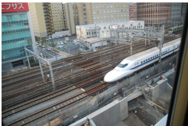
Shinkanzeni jsou vidět jen z jiných dopravních prostředků

Pokud se Čech nějakou náhodou ocitne v Japonsku, má většinou touhu projet se rychlovlakem shinkansen. Pokud se zde ocitne liberečák a pokud se zde ocitne v zimě, má většinou touhu projet se na lyžích. Japonsko nabízí obě tyto jízdy během jednoho dne s perfektním japonským servisem a dokonce za velmi lákavou cenu (myšleno v japonských rozměrech).