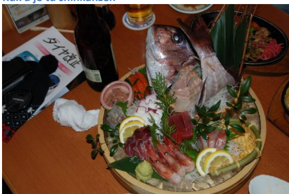
Ahoj rybo. Neuteč mi!