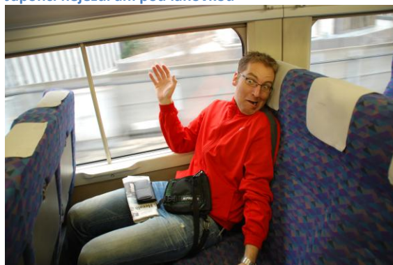
Zrychlení je opravdu obrovské...