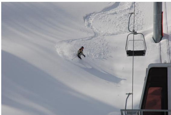
Stopy v japonském prašanu