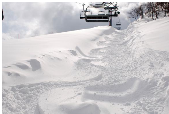
Japonci nejezdí ani pod lanovkou