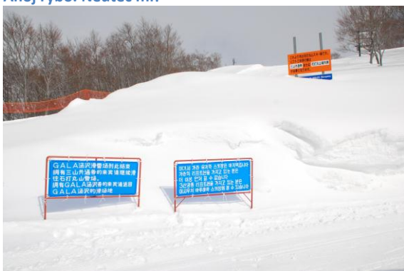
Ve středisku je zakázána spousta věcí, ale co přesně?