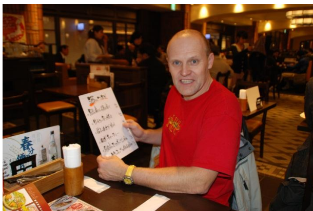
95% Japonců neumí anglicky, 99% Čechů japonsky

bylo dojet si na nádraží. Ke vstupu na nádraží je však zapotřebí jízdenka. Kupujeme nejlevnější za 160 yenů s tím, že ji pak využijeme na odjezd metrem, a vstupujeme do budovy. Směrovky nás velmi jistě vedou bludištěm chodeb a pochvalujeme si, jak jsme na Japonský systém vyvráti. Inu Češi se neztratí! Po několika obrazech se dostáváme k druhému turniketu, kde již je potřeba mít jízdenku přímo na shinkansen. Snažíme se přesvědčit dozor, že se chceme jen podívat, ale jazyková bariera, nepochopení, nesmyslnost dotazu či snad kombinace všeho, nám zabraňuje ve vstupu.