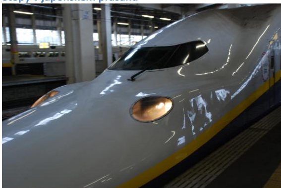
Kuk a je tu shinkansen