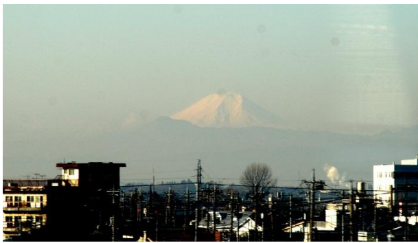
Fuji ve vzdálenosti 160 km

pokladnu. Po chvíli ji nacházíme a dozvídáme se, že tady ANO! Je pravda, že tato pokladna je ze všech nejzelenější. Pak již všechno funguje naprosto japonsky. Kupujeme lístek a dozvídáme se, že nejbližší shinkansen odjíždí za 5 minut. V pohodě přes dva turnikety docházíme na nástupiště, zde stojí fronty u jednotlivých nástupů do vlaku, který již zde vyčkává. Vlak je složen ze dvou souprav a popsán pouze rozsypaným čajem. Ptáme se malé starší nádražáčky, ta nás posílá dozadu, pak si uvědomuje, že se to špatně a běží za náma a dovádí nás až do vagonu v první soupravě. Vlak je skoro prázdný a vyráží, jak jinak, naprosto přesně.