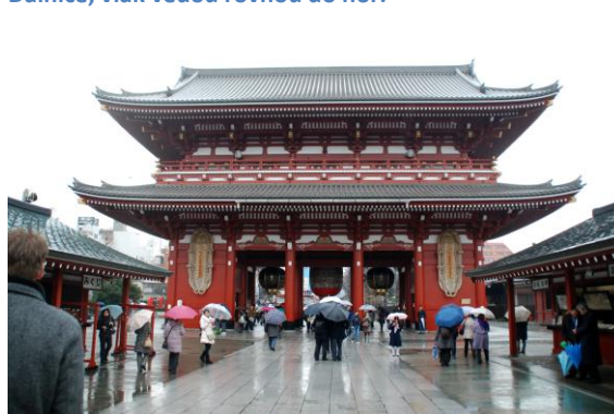
A trochu duchovna a kultury na závěr....