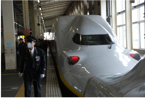
Obsluha se se svým lakem ztotožňuje téměř dokonale

pokladnu. Po chvíli ji nacházíme a dozvídáme se, že tady ANO! Je pravda, že tato pokladna je ze všech nejzelenější. Pak již všechno funguje naprosto japonsky. Kupujeme lístek a dozvídáme se, že nejbližší shinkansen odjíždí za 5 minut. V pohodě přes dva turnikety docházíme na nástupiště, zde stojí fronty u jednotlivých nástupů do vlaku, který již zde vyčkává. Vlak je složen ze dvou souprav a popsán pouze rozsypaným čajem. Ptáme se malé starší nádražáčky, ta nás posílá dozadu, pak si uvědomuje, že se to špatně a běží za náma a dovádí nás až do vagonu v první soupravě. Vlak je skoro prázdný a vyráží, jak jinak, naprosto přesně.