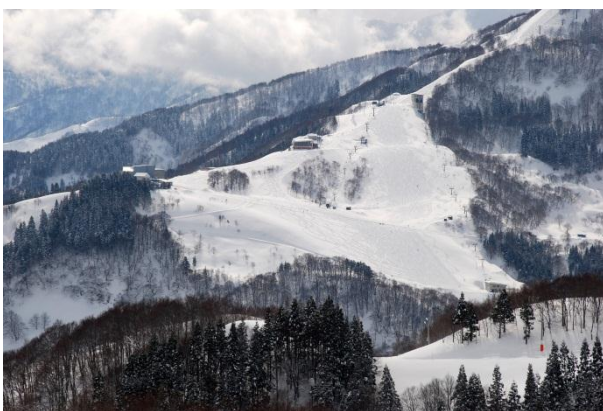
Yuzawa – lyžování od 400 do 1100 metrů

jede, a ani si nevšimneme, že rychlost stoupla na 235 km/hod. Vlak jede klidně a není to prakticky znát. Žádné mlácení pražců a přejezdy přes výhybky.